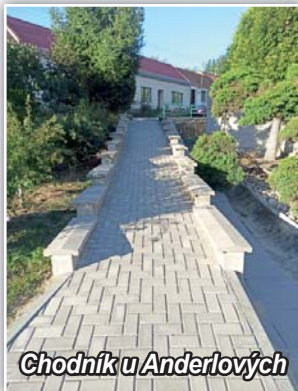
Chodník u Anderlových