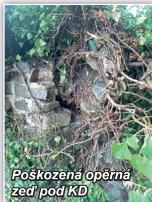
Poškozená opěrná zeď pod KD