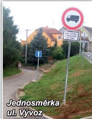
Jednosměrka ul. Vývoz