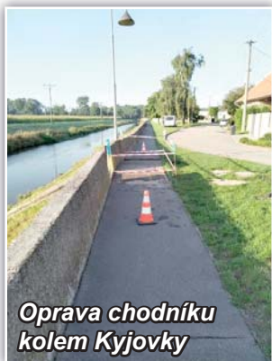
Oprava chodníku kolem Kyjovky