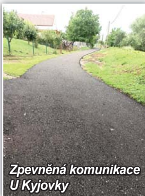
Zpevněná komunikace U Kyjovky