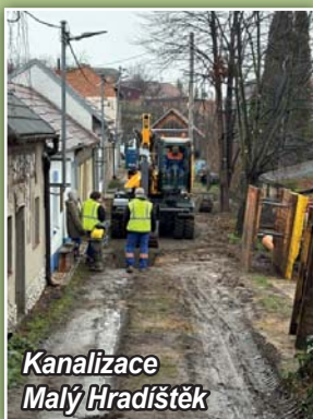
Kanalizace Malý Hradištek