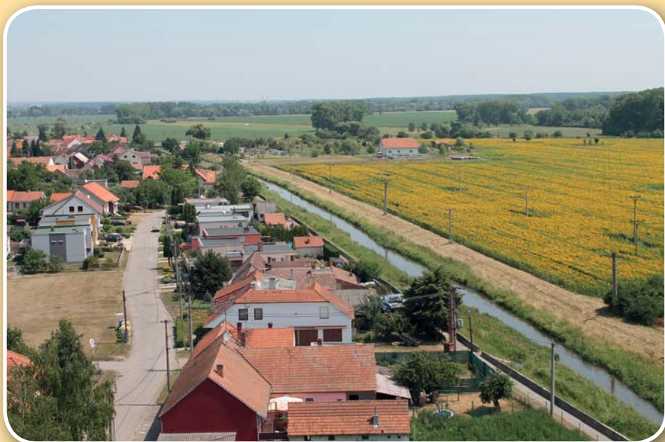
Pohled na Týnec z věže