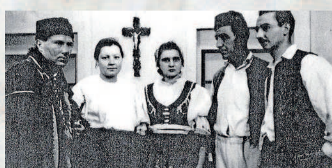
OCHOTNÍCI. V kulturním životě v Týnci nechybělo divadlo. Například v roce 1960 nacvičili divadelníci hru Maryša nebo jejich mladší kolegové o devět let později Broučky.