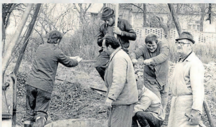
DO PRÁCE. Budování studny pro školu u transformátoru v roce 1979.