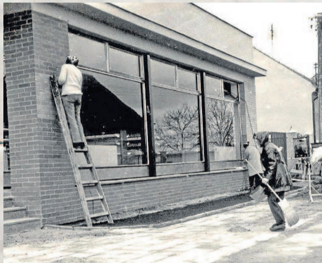
PŘED NOVÝM OBCHODEM. Konečné úpravy místních na obchodním domě v roce 1976.