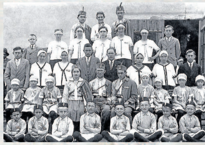
SOKOLI. U řeky Kyjovky po roce 1929 vznikla vhodná plocha, která byla upravena pro cvičení sokolského spolku.