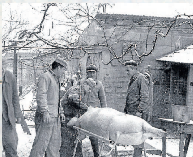
NA DVOŘE. Pravidelně se v Týnci dělávaly v zimních měsících tradiční zabíjačky.