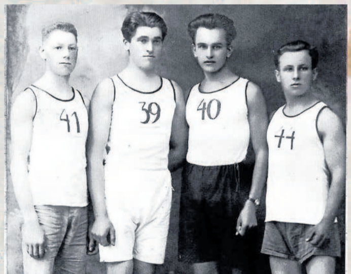
BĚŽCI. Vítězové běhu na pět kilometrů v dubnovém závodě z roku 1945.