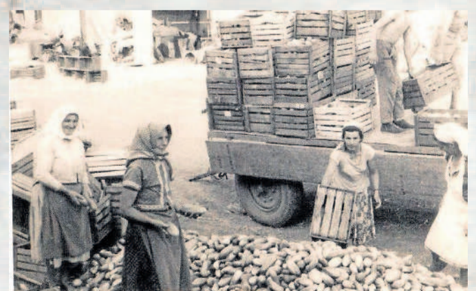
UVLEČKY. Ženy, které pracovaly v Jednotném zemědělském družstvu, byly vyfotografované při třídění okurek.

Další díl již v pátek 10. srpna z Dolních Dunajovic.