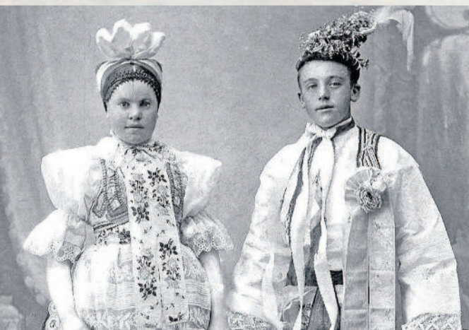
STÁRCI. Tradiční krojované hody se v Týnci konají pravidelně na přelomu srpna a září. Tradice trvá dosud.